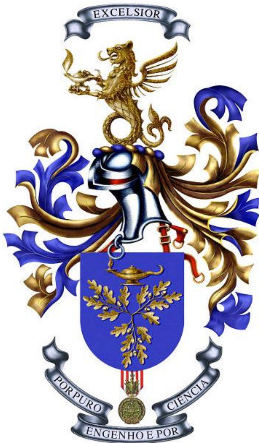
ARMAS DO INSTITUTO DE ESTUDOS SUPERIORES MILITARES

(Anexo à Portaria n.º 970/2006, de 29 de Maio do MDN)