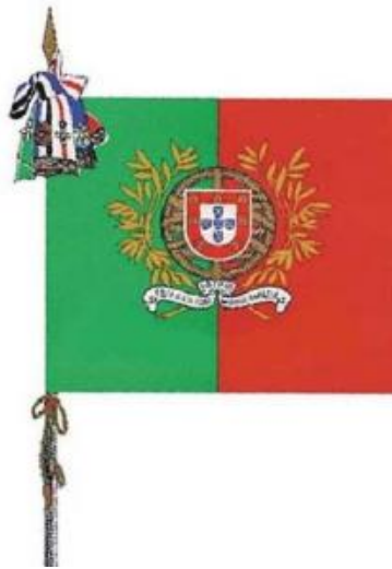
Figura 2 – Estandarte Nacional