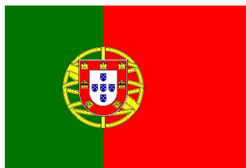
Figura 1 – Estandarte Nacional

Cinco dias após a revolução, o Governo Provisório nomeou uma comissão para o estudo da bandeira. No dia 29 de novembro de 1910, foi aprovada a nova bandeira nacional: o azul e branco da Monarquia são, então, substituídos pelo verde e rubro da República. O regime republicano pretendia, assim, enfatizar o seu projeto de renascimento da Pátria. A bandeira nacional foi ratificada pela Assembleia Nacional Constituinte, na sua sessão inaugural, a 19 de junho de 1911.